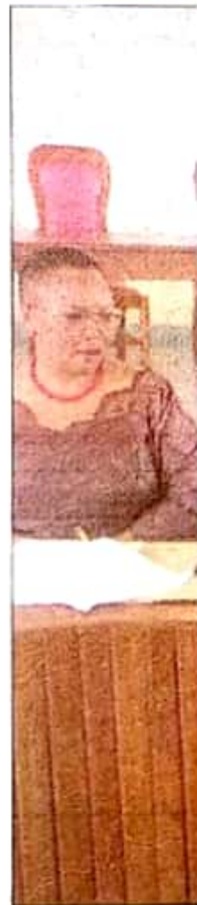
Naibu Waziri wa Haki Manyara, akizunguza

Vyama ambavyo vigezo na wagombe teuliwa ni Julius Mae Wazalendo, Dk. Flo wa CCM na Phillip Democratic Party (E Msimamizi wa ucl