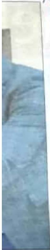
ajili ya ini. Jijini