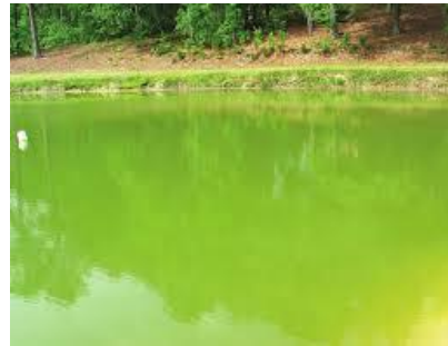
bwawa lililo rutubishwa

chakula duni husababisha udumavu wa samaki. Kwa kawaida, bwawa lililorutubishwa, hutengeneza chakula cha asili ambacho ni nafuu na hupunguza gharama za uzalishaji. Ili kufuga kwa tija na kupata mavuno makubwa, inashauriwa mfugaji atumie chakula bora cha ziada. Ubora wa chakula ni pamoja na uwepo wa virutubisho muhimu na urahisi wa kumenge'nywa na samaki.